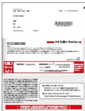
【 サービスご利用のご案内 】