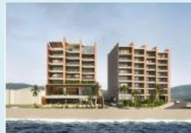
ファンドを通じて、リゾート型宿泊施設「 FAV HOTEL小豆島安田プロジェクト 」(香川県小豆島町)に対する支援を実施し、地域の観光産業活性化に関与