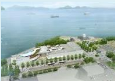
ファンドを通じて「 四国水族館 」(香川県宇多津町)の新規建設を支援し、地域の観光拠点を創出