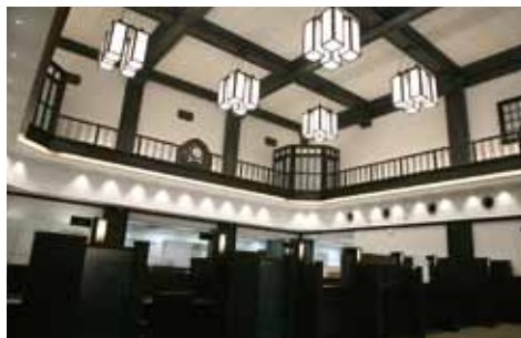
高松支店 (平成25年9月17日)