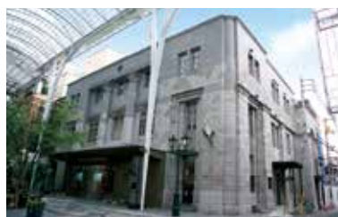
現在、この場所は高松支店となっています。

明治5年、わが国に銀行制度が採用され、国立銀行条例が公布されました。この条例に従って明治5年～12年の間に第一国立銀行から第百五十三国立銀行まで153の国立銀行が全国各地に設立されました。