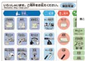
▲コミュニケーションボード