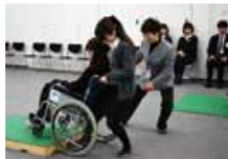
▲お手伝いのできる行員の育成