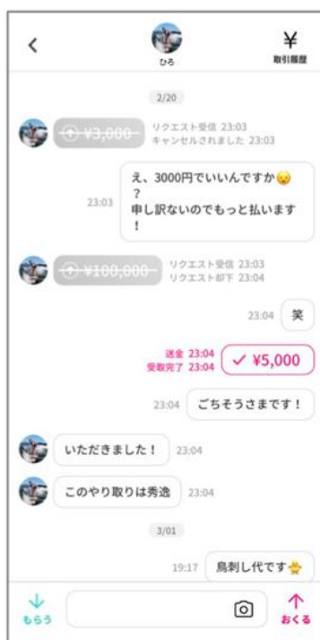
⑤ 登録が完了すると、 お金コミュニケーションを お楽しみいただけます。