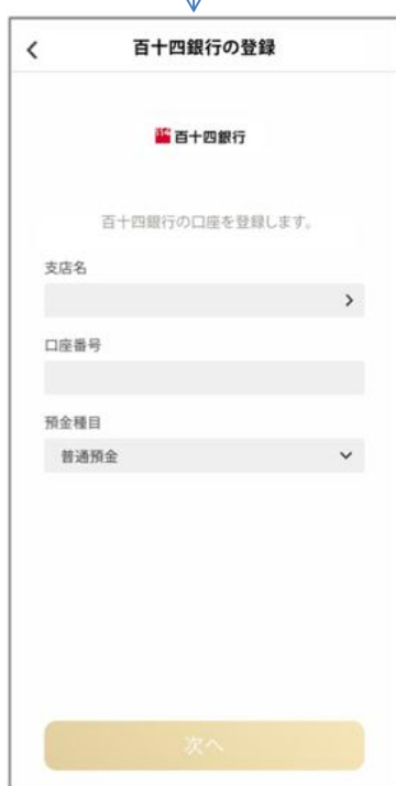
④ 画面に沿って 口座情報を入力