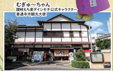
むぎゅうちゃん 讃岐もち麦ダイシモチ公式キャラクター 普通寺市観光大使