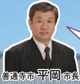
普通寺市 平岡 市長

弘法大師空海の御誕生地である普通寺市で生まれた「讃岐もち麦ダイシモチ」は、食物繊維が豊富で注目されています。紫の穂に色づく街並みを見ながら、本市の魅力をご存分にお楽しみください。