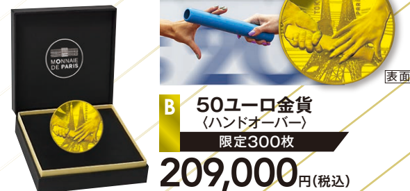
B 50ユーロ金貨 (ハンドオーバー) 限定300枚

ハンドオーバーとはオリンピック開催都市の引継ぎのこと。リレー競技で、日本の男子選手から、ネイルアートをしたフランスの女子選手にバトンをつなぐ様子を描写。背景には東京タワーとエッフェル塔を描き、東京→パリ間のハンドオーバーを表現。