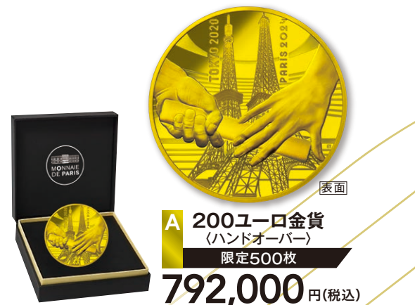
A 200ユーロ金貨 (ハンドオーバー) 限定500枚