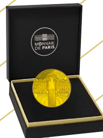
D 50ユーロ金貨 (コンコルド広場) 限定300枚