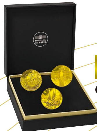
E 金貨3種セット B C D

1875年に完成したパリのガルニエ宮(オペラ座)をデザイン。上部にはガルニエ宮の外観の屋根にあるペガサスのブロンズ像を描き、その周りには競技場のトラックを描写。ガルニエ宮は有名ミュージカル「オペラ座の怪人」の舞台となった場所。