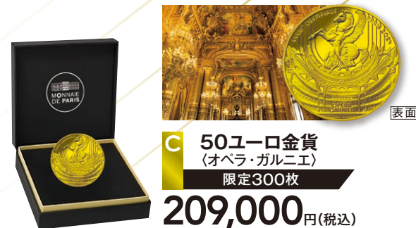
C 50ユーロ金貨 (オペラ・ガルニエ) 限定300枚