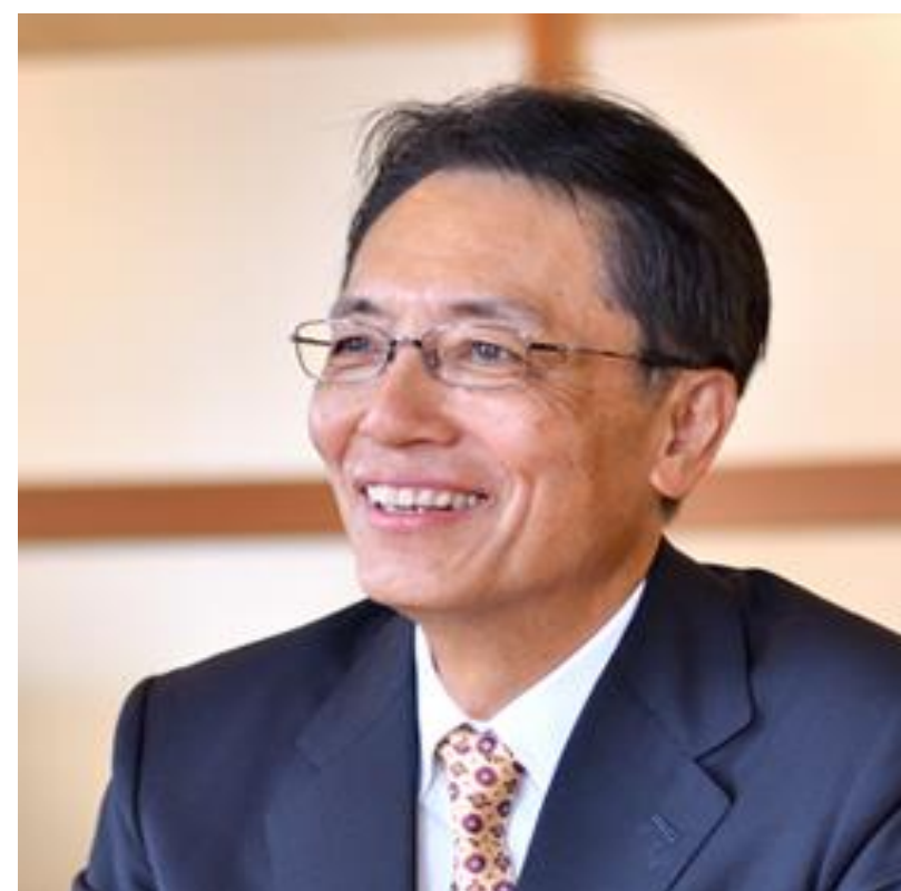
株式会社青山財産ネットワークス 代表取締役社長