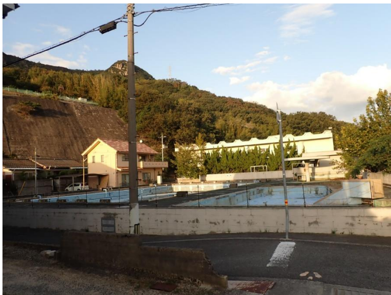
プール及び体育館