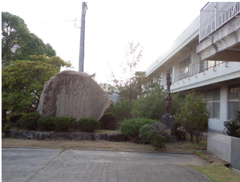
校庭の モニュメント