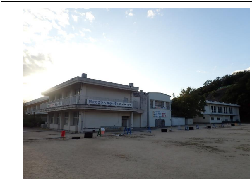
グラウンドから 主校舎と体育館