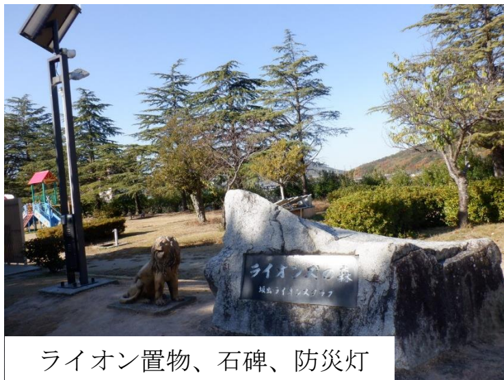
ライオン置物、石碑、防災灯