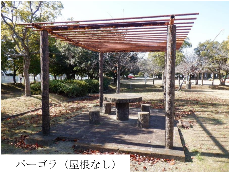
パーゴラ（屋根なし）