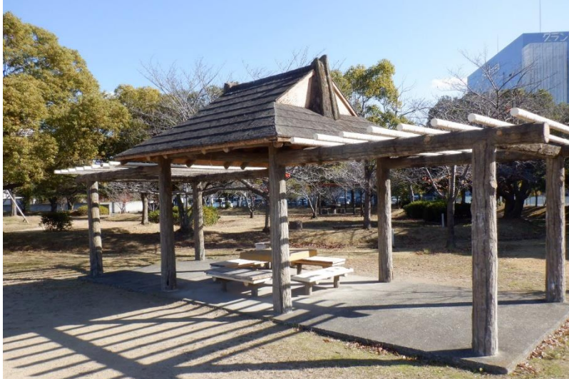
パーゴラ（屋根あり）