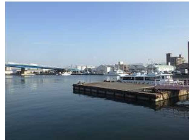
②西運河 A 号浮棧橋