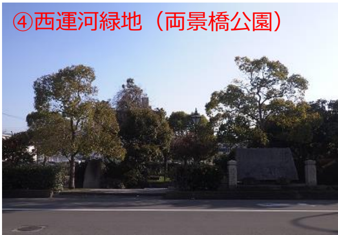
④西運河緑地 (両景橋公園)