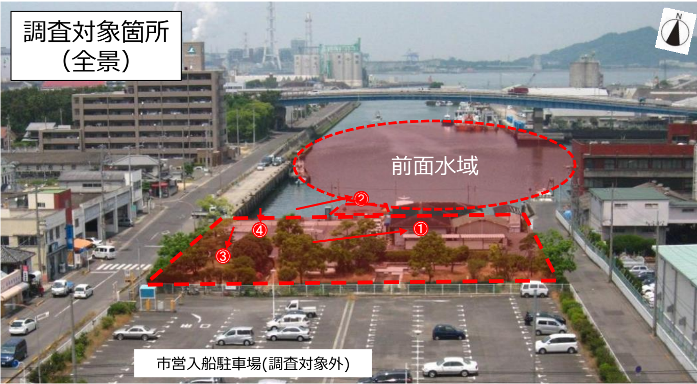
調査対象箇所 (全景)