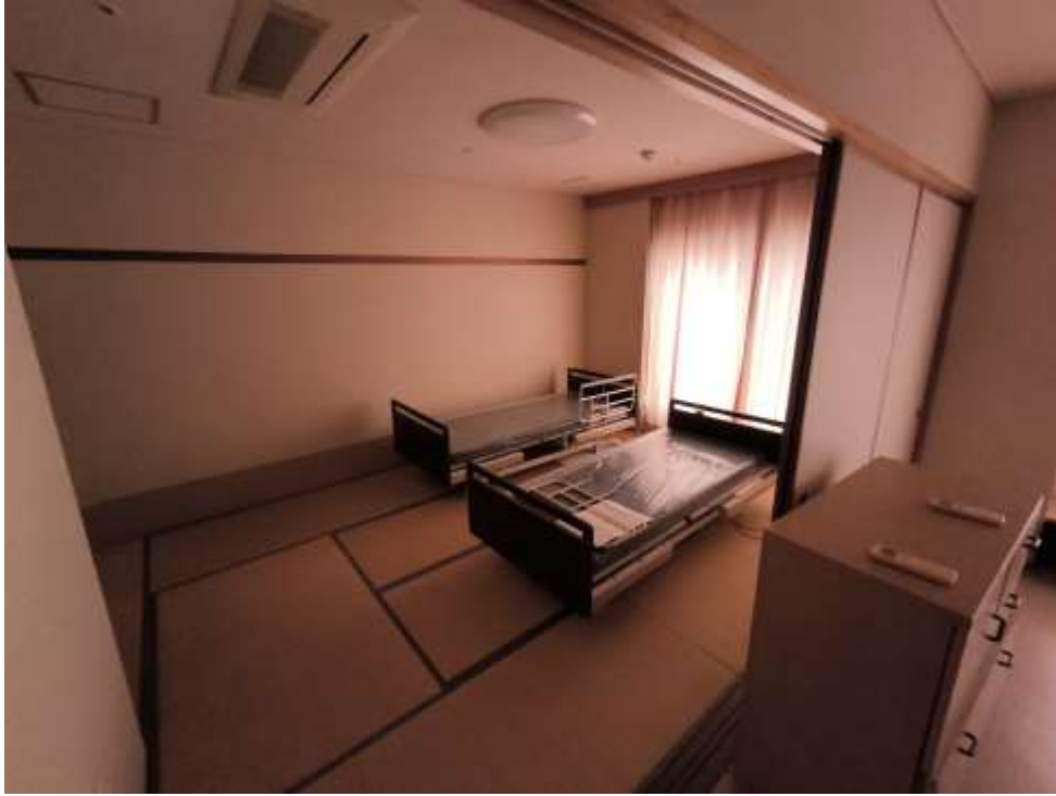
(18) 本館 1 階 1 人部屋