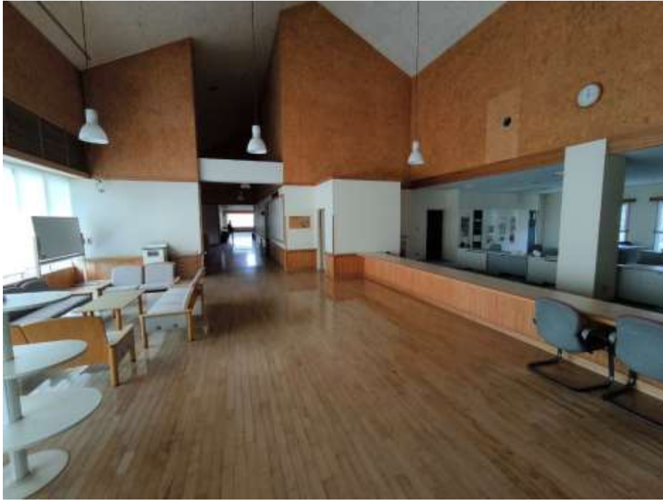
(9) 本館 2 階在宅介護支援センター