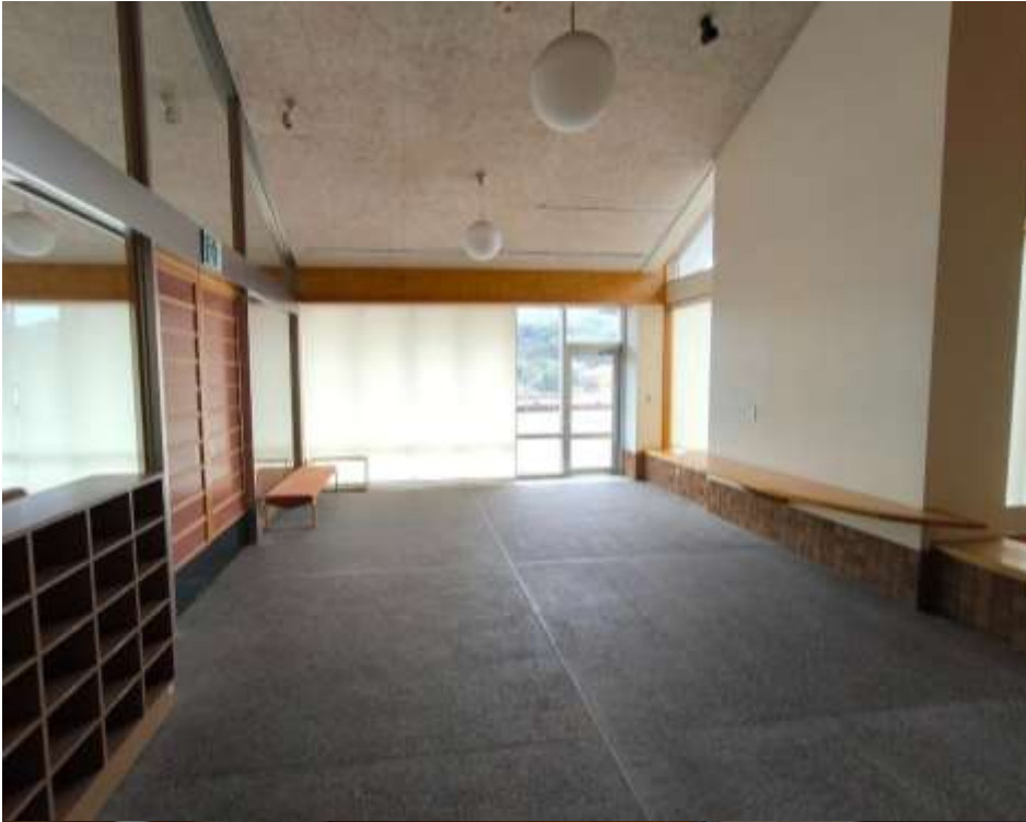
(7) 本館 2 階玄関