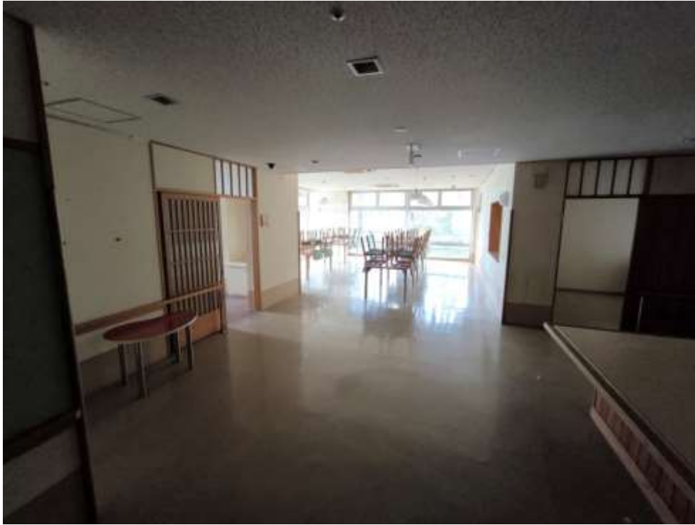
(20) 本館 1 階調理場