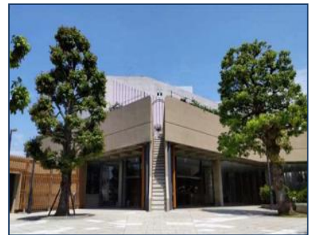
市民ホール（ホワイエ）の利活用 (坂出市)