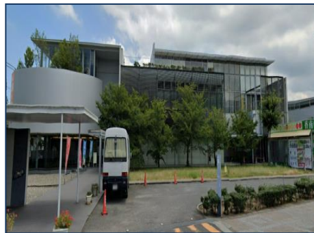
香南楽湯の活用について (高松市)