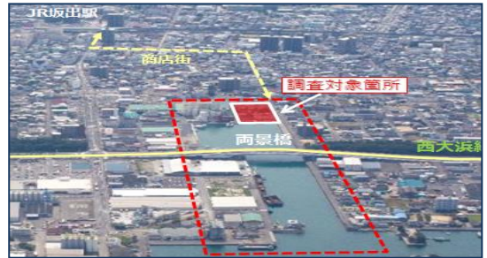
西運河地区における「みなと」を活かした賑わい創出 (坂出市)