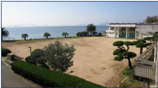
旧戸形小学校学校跡地の利活用 (土庄町)