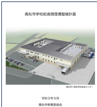
学校給食調理場整備事業 (牟礼・庵治地域等、香南・香川地域等) (高松市)